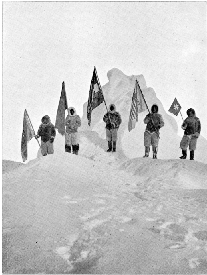
Etter Peary 1909 De fem flaggene på polen ([1909], c1910).

Etter et fotomekanisk rastertrykk i boken The North Pole , Robert E. Peary (London: Hodder & Stoughton 1910).