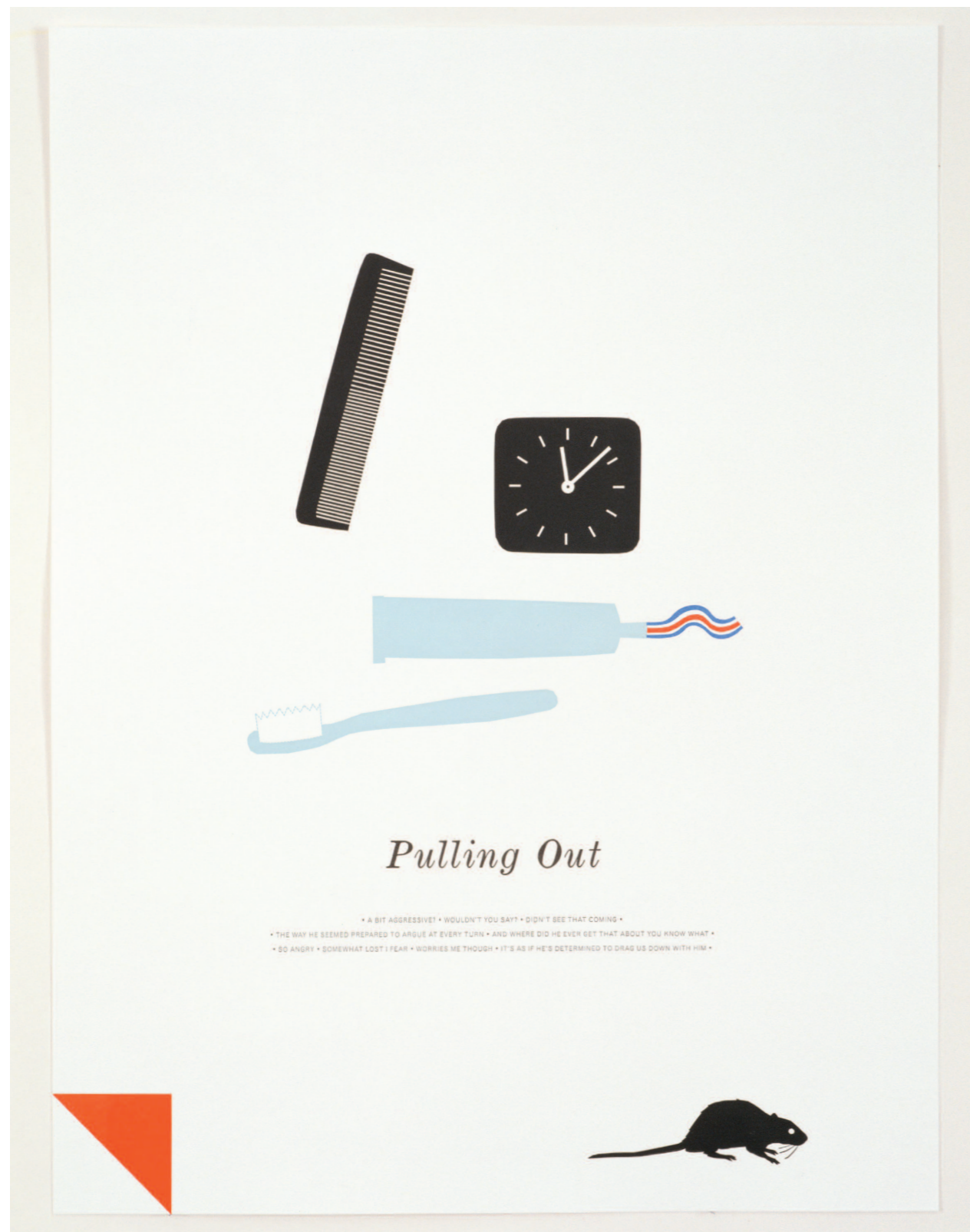
Matthew Brannon, Pulling Out (del av gruppe på 12), 2007 høytrykk på papir, 61 x 45.7 cm. Med tillatelse fra kunstneren og Friedrich Petzel Gallery

i Vestens tankesett, men hva skjedde med det Onde? Faldbakken viser oss en slags forvist negativitet, der ondskaperen er hvitvasket eller har gjennomgått en plastisk operasjon. For Faldbakken opptrer det Onde som desperat terror, som virus, eller som en uforutsigbar ulykke i et system som har som mål å gjøre alt positivt, øyeblikkelig realisert og gjennomskinnelig. Det Onde er aldri i mennesket, som en del av det, det er en sykdom, som må vaskes og renses med piller, settes i terapi, eller borttegnes med forsikringspenger. Det Onde kan ikke integreres i livet, men dermed mister livet også kraft. Det Onde hos Faldbakken er ikke selvmordet, ulykken, døden, vold og fattigdom, for dette vil falle inn i en binær kulturell konstruksjon som gir forestillingen om det Gode en evig og illusorisk essensiell kvalitet.