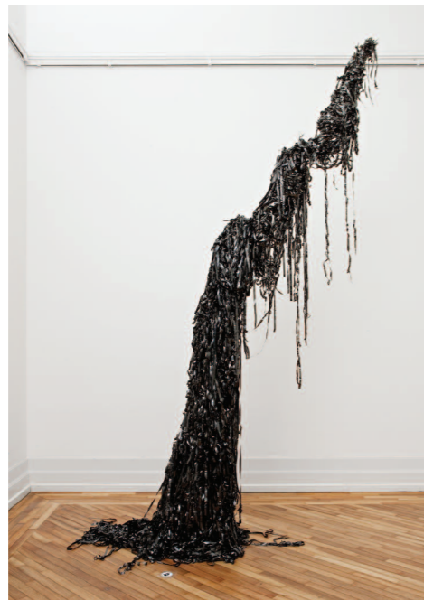
Untitled (Main Frame Sculpture) , 2007 Foto: Vegard Kleven