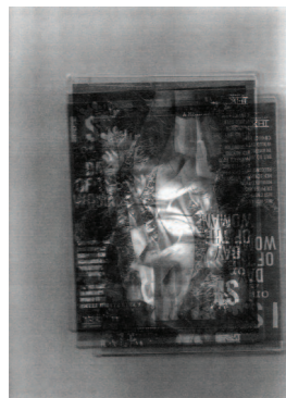
Matias Faldbakken Triple Cover Xerox #2 , 2009 Xerox på papir, 29,7 x 21 cm

for medierte bilder fått ny status som primitive totemer. Video Sculpture er inspirert av et fotografi fra Kabul som viser hvordan Taliban hengte opp innmaten av et videobånd på en pølse midt i byen; symbolet på Vestens kulturimperialisme vises frem som en Satans engel – ondskapen relanseres i Vestens positivisme. Mediets tilstedeværelse løftes til