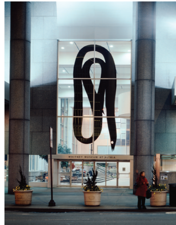
Matthew Brannon, The Price of Admission , 2007 Whitney Museum. Matt PVC-folie på glass, 802,6 x 332,7 cm Med tillatelse fra kunstneren og Friedrich Petzel Gallery, NY

I en æra av postmodernisme er tegnets mening like flytende