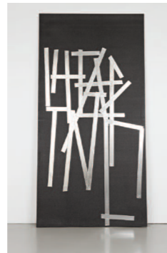
Mattias Faldbakken, Untitled (MDF#5) , 2009 Aluminium-tape på grå MDF, 2,50 x 12,5 x 1,9 cm

Både Faldbakken og Brannon lokaliserer en usikker sone mellom tegnets standardiserte utgave og dens imaginære utgave der vi, uansett hvor besynderlig den kan fremstå, skaper en egen verden, en annen virkelighet.