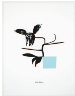
Matthew Brannon, Sick Whore , 2006. Silketrykk på papir 76.2 x 58.4 cm, 1/1 Friedrich Petzel Gallery